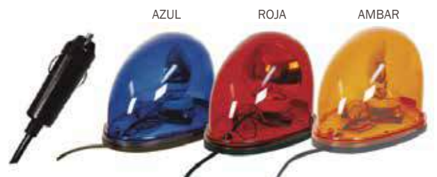
● N° 6547 ● N° 6548 ● N° 6546 Emb x: 30

Báliza 12 V rotativa con hembra cigarro y cable espiralado. Base imantada.