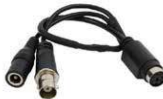
Emb x: 1