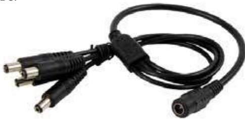
Emb x: 100