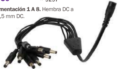
Emb x: 100