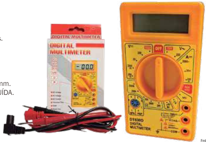
Emb x: 1/100